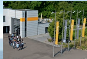
Besucherzentrum psi forum