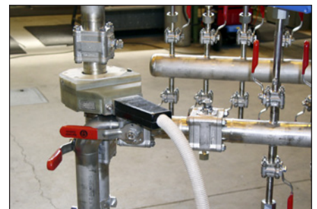
Orbitalschweissung an dünnen Rohren ohne Kaltdrahtzufuhr.