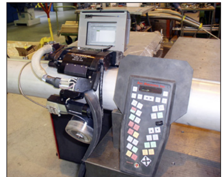
Orbitalschweissung an dicken Röhren mit Kaltdrahtzufuhr.

aufrecht zu erhalten muss die Gasaufnahme der gesamten Apparatur extrem klein sein. Dies lässt sich nur durch UHV-taugliche Materialien, perfekte Schweißnähte und Ausheizen der gesamten Apparatur über längere Zeit bei Temperaturen von etwa 300 °C erreichen.