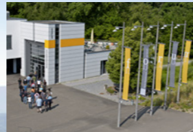
Centre de visiteurs psi forum