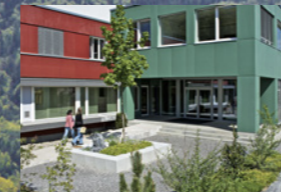
Centre de protonthérapie