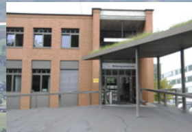
Centre de Formation du PSI