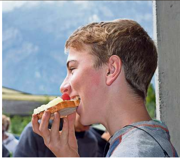
Zigerbrüt: Die Lehrlinge beissen beherzt zu und lernen so das Glarnerland auch noch von seiner kulinarischen Seite kennen.